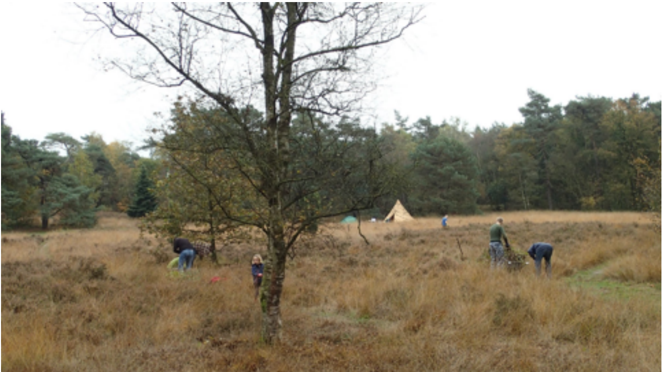
Den Treek, najaar 2015

Het aantal evenementen is beperkt gebleven. Een nieuwjaarsbijeenkomst en vier werkdagen zijn goed bezocht en er is hard gewerkt. Met Pinksteren was er weer het kinderjeudeboulestoernooi.