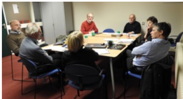
het hoofdbestuur vergadert aan de Larikslaan 5, Leusden