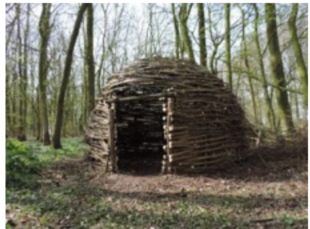
beelden van de activiteiten van de caravansectie

De 14 daagse Duitslandtoer in augustus was zeer snel volgeboekt en werd hoog gewaardeerd. Dit alles dankzij een zeer actieve toercommissie.